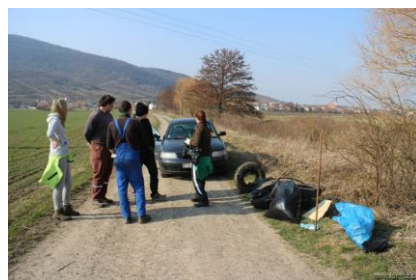
- jarné upratovanie -