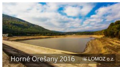
Horné Orešany 2016 LOMOZ o.z.