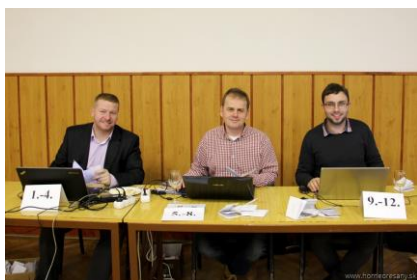
- odborná degustácia vín -