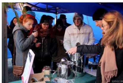
- Vianočný punč -