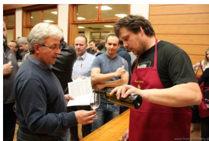
- verejná ochutnávka vín -