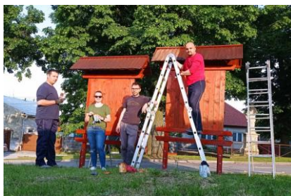
- obnova tabúľ -