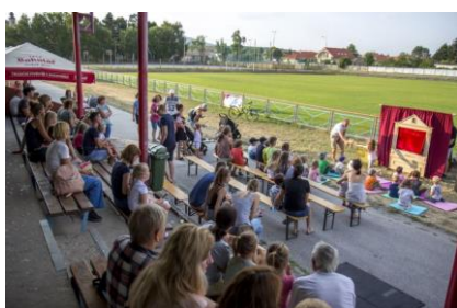
- kino - trhy -