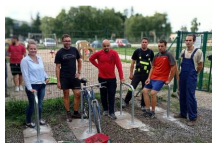
- reCyklo brigáda -