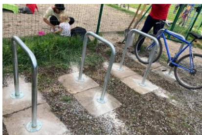
- reCyklo - cyklostojany -