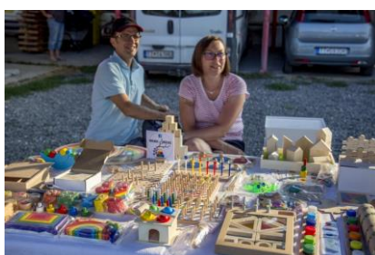
- kino - divadlo -