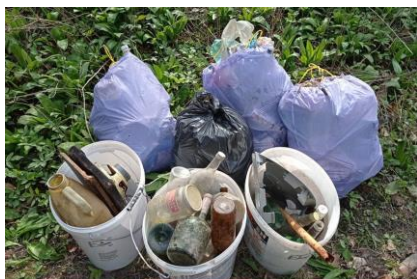
- jarné upratovanie -