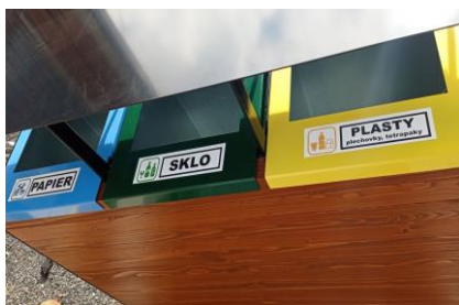
- reCyklo - koše -