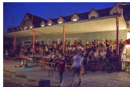
- kino -