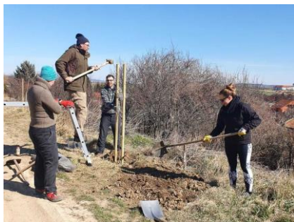
- Strom za rok -