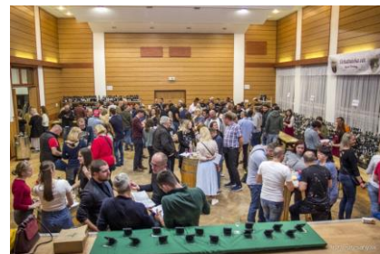
- Orešanská košťofka -