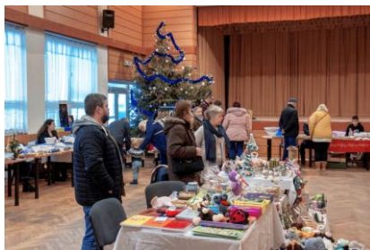
- Vianočné trhy -