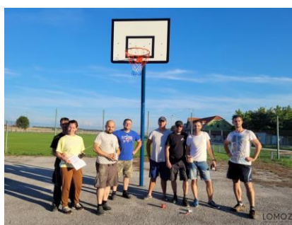
- basketbalové ihrisko -