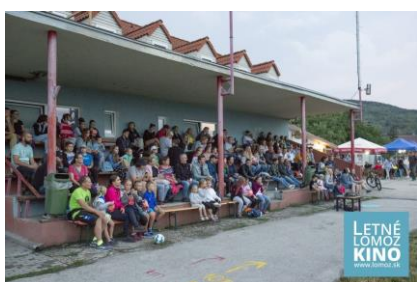
- letné kino -