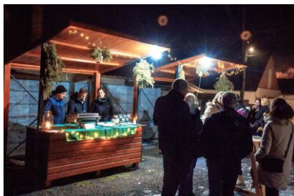
- Vianočný punč -