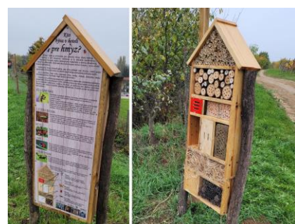
- hotel pre hmyz -