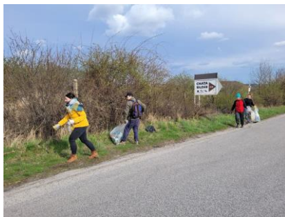
- jarné upratovanie -